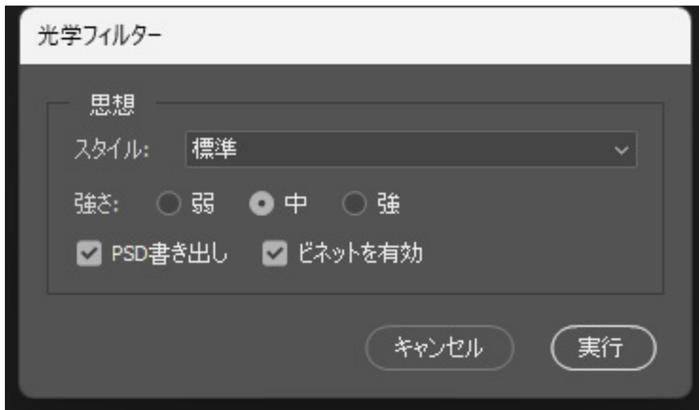
メイン操作ダイアログ

SideKick_Portrait.jsxbin をダブルクリックすると「Sidekick Portrait」ダイアログが開きます。スタイルと強さを選び「実行」を押すだけです。